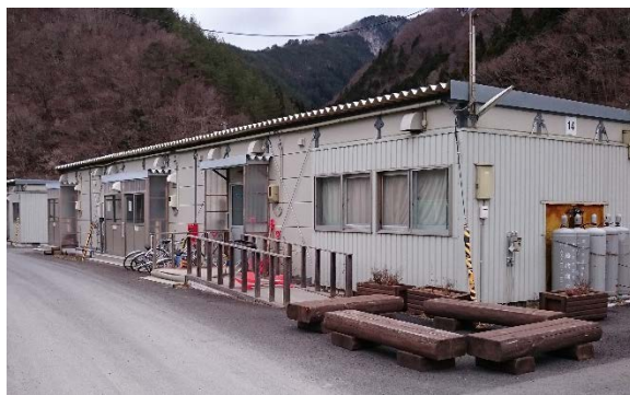
(簡易宿舎現況(釜石市))