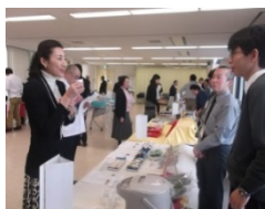
(加工品コンクール)