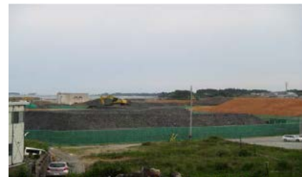
(残土置き場(片浜地区))