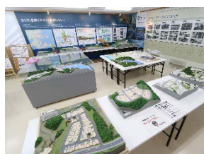
(まちづくり情報交流館の内部(女川町))

※ このほか、基幹事業に入札不調が発生し、喫緊に事業費の増加が必要な場合には、一括配分を流用して用いることができる。