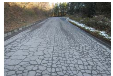
(損壊した道路の状況)