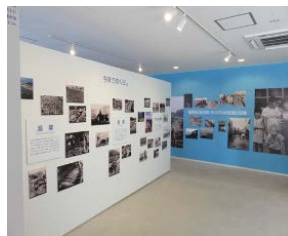
(まちづくり情報館の内部(石巻市))