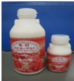
(いちごの飲むヨーグルト)