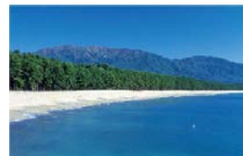
(被災前の陸前高田市の海岸)

陸前高田市では、震災前の観光客の利用状況等を踏まえ、砂浜を再生する区間を被災前の約半分とし、また、砂の量を削減するなど、コストを縮減。