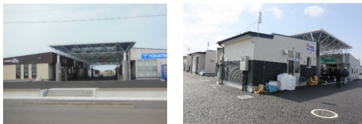
(亘理町荒浜にぎわい回廊商店街)

亘理町…防集移転元地において、効果促進事業により産業用地を整備。27年3月に完成し供用が既を開始され、具体的な利用企業は、飲食店、小売店(鮮魚・水産加工品、総菜、自転車、サーフィン用品)等が立地(これらの事業者はグループ補助金を利用し商業施設を整備)。