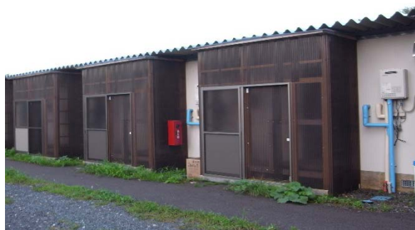
(簡易宿舎現況(宮古市))