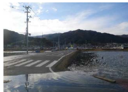
(大船渡市の冠水状況)